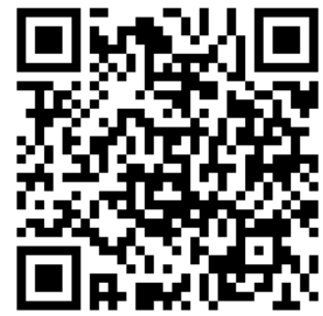
事前登録用二次元バーコード